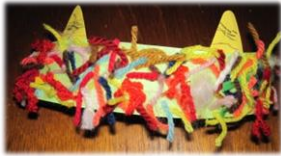
1~2月の制作：子鬼のヘアバンド