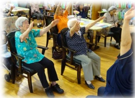
体育（健康長寿体操）