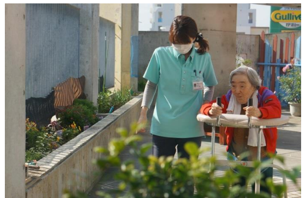
6階中庭での水かけの風景

ご利用時のご家庭での普段の生活に沿った援助方法を提供したいと思います。 事前に生活相談員が自宅へ訪問し日常生活のご様子を拝見させていただいた上で詳細な説明を行い契約を行います。