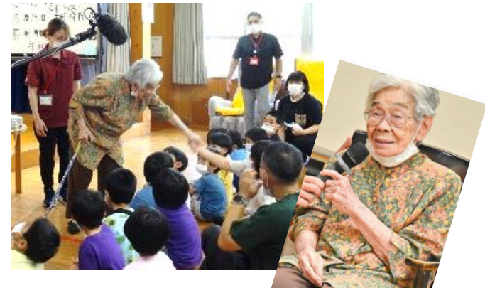
「人をあやめないで」