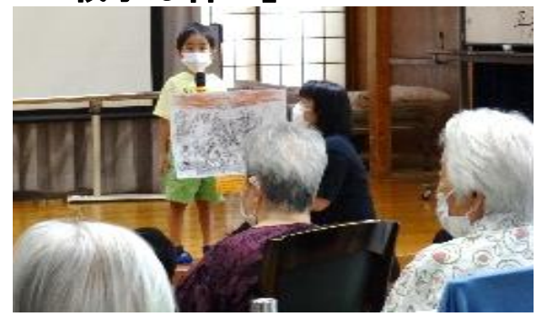
「かわいそうだと思った」