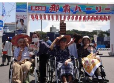
那覇ハーリー見学