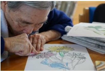
手工芸活動（ぬり絵、編み物）