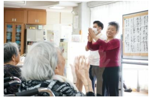
さくらんぼクラブ （手話ダンス）